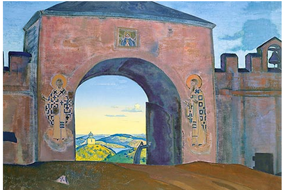
Y Abrimos los Portales por Nicolás Roerich, 1922

En Zanoni Edward Bulwer-Lytton describe, en estilo de incomparable belleza, la invocación del adepto purificado a su propio Augoeides, dándonos a entender que mientras se interponga el más ligero vestigio de pasión terrena, el hierofante quedará desvirtuado para comulgar con su alma inmaculada.