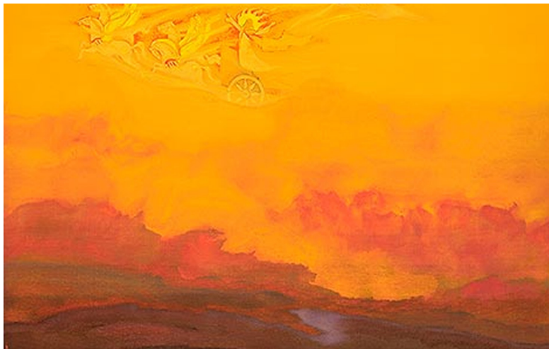
Elias el Profeta por Nicolás Roerich, 1931

no admite expresión nominal real, ese poder que solamente es en sí mismo, que sostiene a los dioses, a los cielos y a todo ser viviente, que surge ante la mente del hombre, concebido pero no expresado. Por último le llama Atman, que aunque originalmente significó aliento o espíritu, llega a significar el Ser, únicamente el Ser, humano o Divino; el Ser Creador o sufriente; el Ser único o universal, pero siempre Ser, independiente y libre.