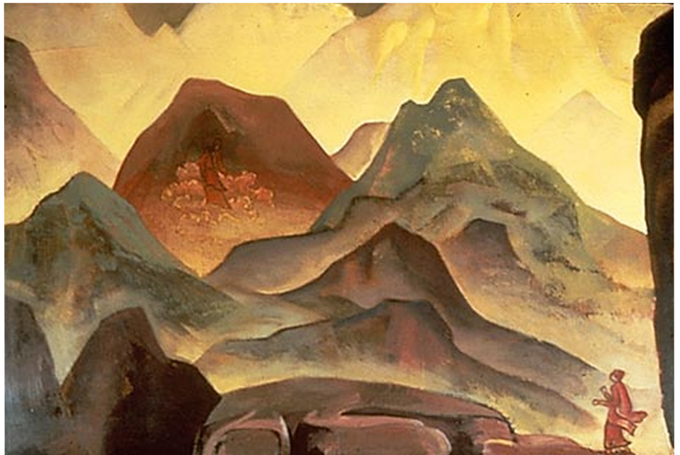
Visión, por Nicolás Roerich, 1923

teria, producía fuego, agua, tierra y aire, y era el único principio eficiente por el cual la materia se mueve. Los estoicos, al igual que los sabios hindúes, creían en la absorción final. San Justino creía que estas almas eran la emanación de la Divinidad, y Taciano el Asirio, su discípulo, declaró que “el hombre era tan inmortal como el mismo Dios.” (12–13)